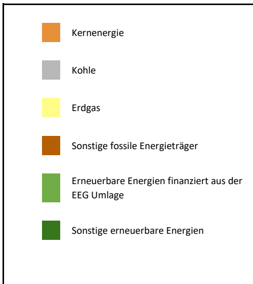
Zum Vergleich Stromerzeugung in Deutschland